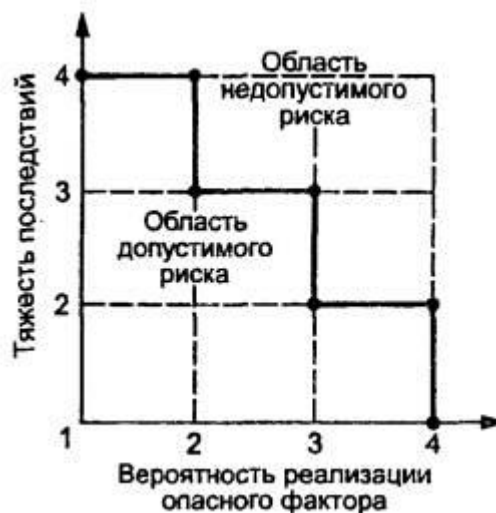
Рисунок Б.1 - Диаграмма анализа рисков

Если точка лежит на или выше границы - фактор учитывают, если ниже - не учитывают.